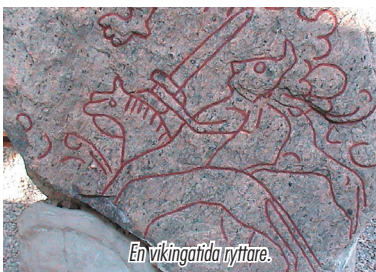
En vikingatida ryttare.