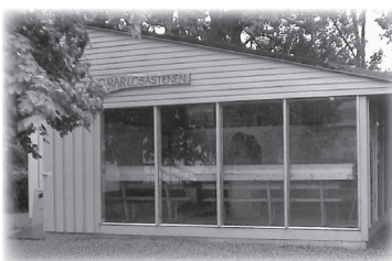
Runstenen står skyddad i ett litet hus.

Runstenen har varit känd sedan 1600-talet men har under större delen av tiden suttit in- murad i Sparlösa kyrka.