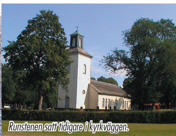
Runstenen satt i tidigare kyrkväggen.