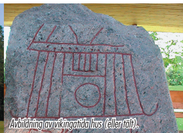
Avbildning av vikingatida hus (eller tält).