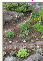
Rabatt med kanaler.

Här finns bland annat små slingrande kanaler så att små bäckar kan rinna bland rabattens blommor.