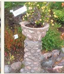
En fristående piedestal.