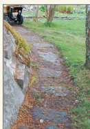
Närbild av den norra stenlagda gången.

Längs båda sidorna av stora gräsmattan finns stenlagda gångar.