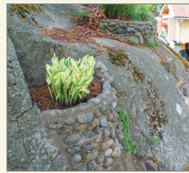
Krukor som gjuts fast direkt i klippan.

Det finns också ett bevattningsystem som förser fontäner och rabatter med vatten.