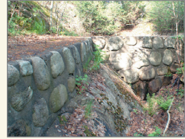
En av flera dammar.

Det finns flera dolda dammar i bergen runt Alaska. De förser trädgårdens fontäner och växter med vatten. Dammen på kartan är den som ligger närmast trädgården.