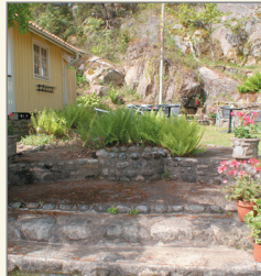
Fontänen vid kiosken.

Inför sommaren 2011 rustades de båda fontänerna upp och fungerar för första gången på flera decennier.