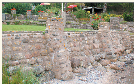
Terrassen vid stranden.